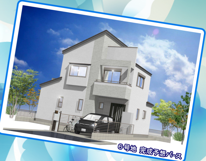
6号地 完成予想パース