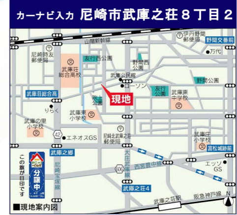
カーナビ入力 尼崎市武庫之荘8丁目2

※建築条件の物件は土地売買契約後3か月以内に売主の指定する工務店と建築請負契約を結んで頂くことを停止条件として販売します。この期間内に建築請負契約が成立しない場合は売買契約は白紙解約となります。